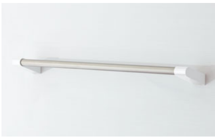
タオル掛け(ホワイト)(L=400)