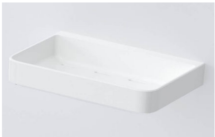
収納棚 W175・正面2段(ホワイト)