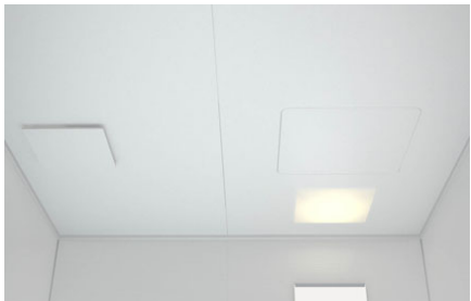
平天井(抗菌・防カビ仕様)(壁高さH2150)